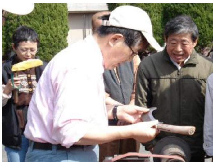
(前回実施したときの研修風景)